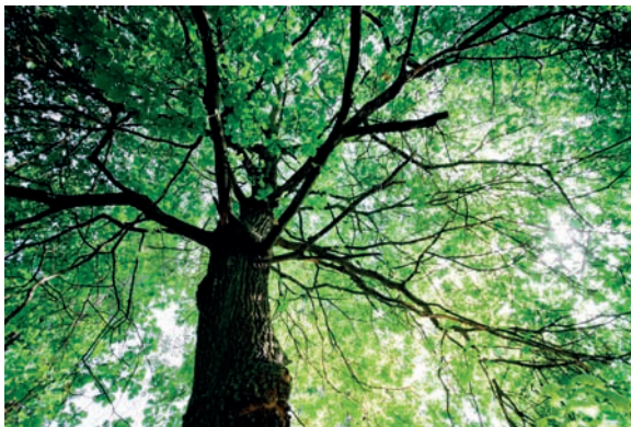
Rysunek 2.2. Przykładowe zdjęcie przedstawiające strukturę organiczną — drzewo.