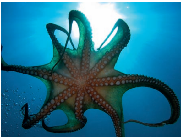
Rysunek 2.3. Przykładowe zdjęcie przedstawiające strukturę organiczną — ośmiornica.